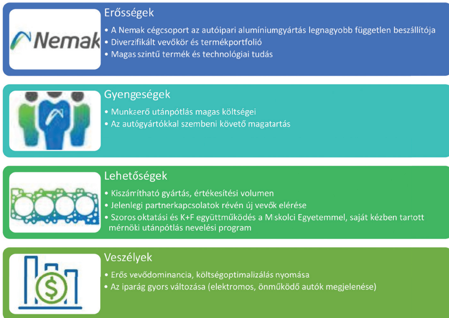
Figure 6 SWOT analysis for Nemak Győr Ltd. in the automotive industry

6. ábra: A Nemak Győr Kft. autóipari mozgástere, nehézségei (SWOT-elemzés)