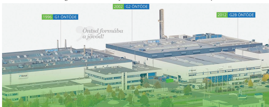
3. ábra: A győri alumíniumöntöde üzemépületei Figure 3 Production plants of the aluminium foundry