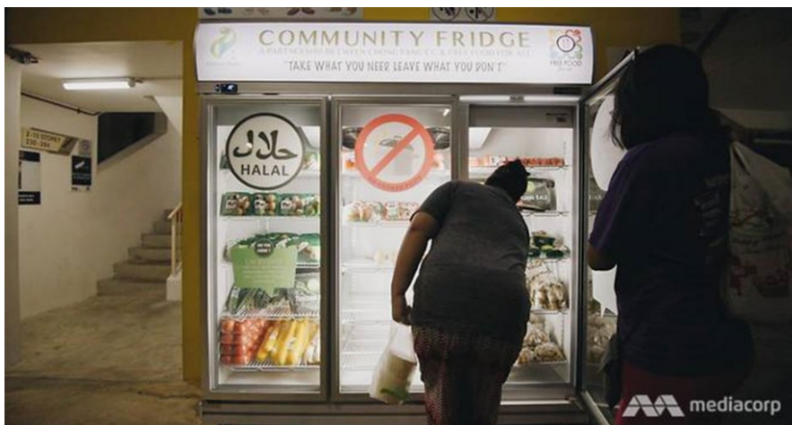
Photo 1 Free Food For All's community fridges

Forrás: Channel News Asia. 2020. 02. 12.