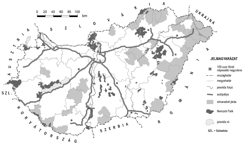
1. ábra A hazai térszerkezeti elemek eloszlásának megyék közötti különbségei Figure 1 Distribution of some elements of Hungarian spatial structure in the counties

Szerkesztette: Szabó Pál és Farkas Máté