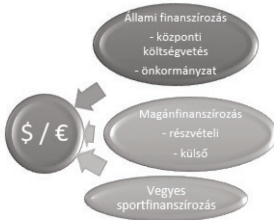
1. ábra: Sportfinanszírozási modell. Bevételi oldal

Hazánkban a sportfinanszírozást a Sporttörvény (2004. évi I. törvény a sportról) foglalja keretbe. Jelenleg a sportfinanszírozás követi a sport dinamikus változását. A sport finanszírozási modellje a finanszírozás inputját és outputját mutatja meg. A bevételi oldalon az állami finanszírozás, a magánfinanszírozás és vegyes sportfinanszírozás jelenik meg (1. ábra). Az output oldalon a bevételekből részesülők jelennek meg, a sportolók, a sportszervezetek és a sportigazgatás (2. ábra).