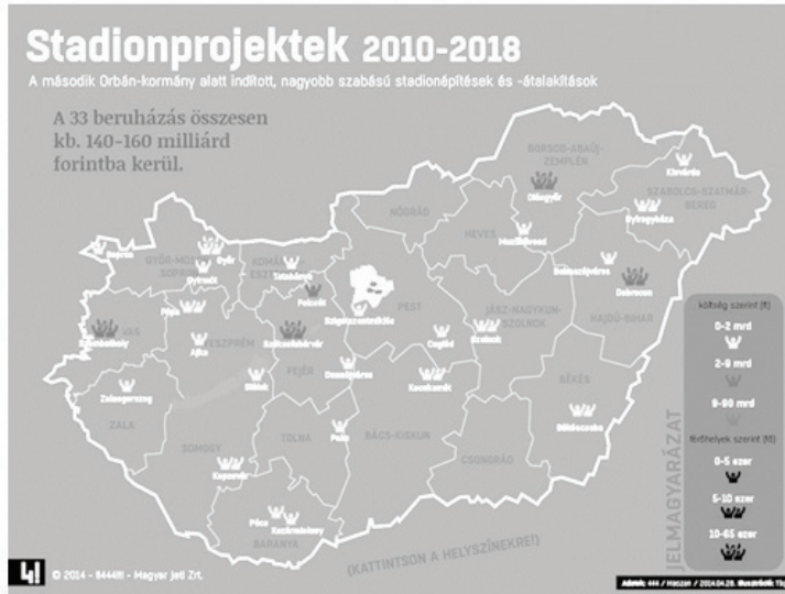
7. ábra Stadionprojektek 2010-2018