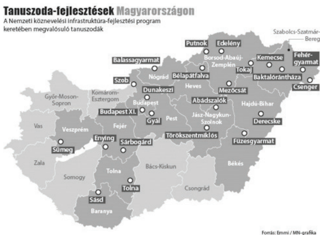
6. ábra: Sportinfrastruktúra beruházások Magyarországon

A tornaterem – és tanuszoda fejlesztések területi elhelyezkedése kelet-magyarországi többségű eloszlást mutat (6. ábra). Ennek oka, hogy a korábbi időszakokban a Nyugat-Magyarországon nagyobb infrastrukturális fejlesztés valósult meg (Ács, 2007).