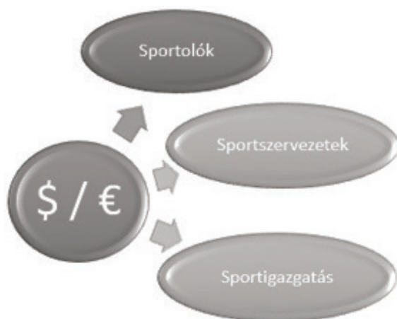
2. ábra: Sportfinanszírozási modell. Kiadási oldal