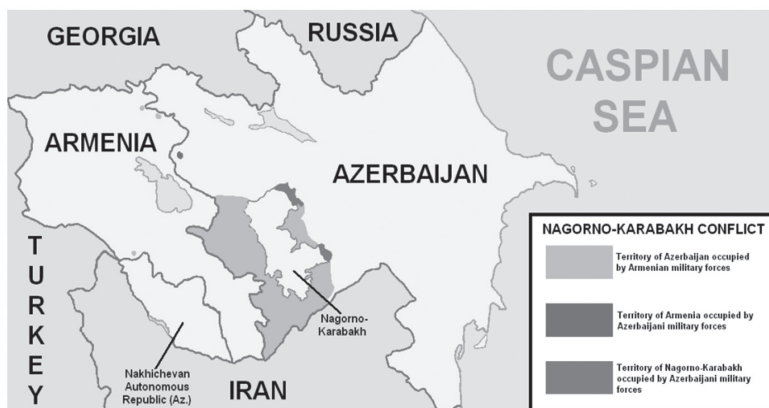
1. ábra: A hegyi-karabahi konfliktus során megszállt területek

Forrás: http://www.valuewalk.com/wp-content/uploads/2016/04/Nagorno-Karabakh-Conflict.png (Letöltés ideje: 2016.04.16.)