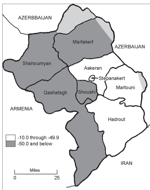
3. ábra: A lakosság arányának csökkenése a Hegyi-Karabahi Köztársaság területén 1989 és 2005 között az egyes régiók szerint

Forrás: Rowland, R. H. (2013): Population Trends in a Contested Pseudo-State: The Case of Nagorno-Karabakh . Eurasian Geography and Economics, 49(1). 99-111.