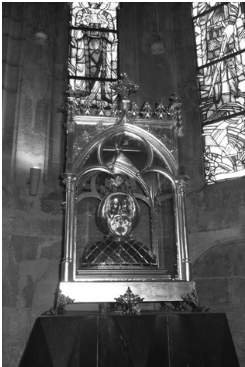
Szent László király (1046-1095, uralkodott 1077-1095) hermája a győri bazilika Héderváry kápolnájában