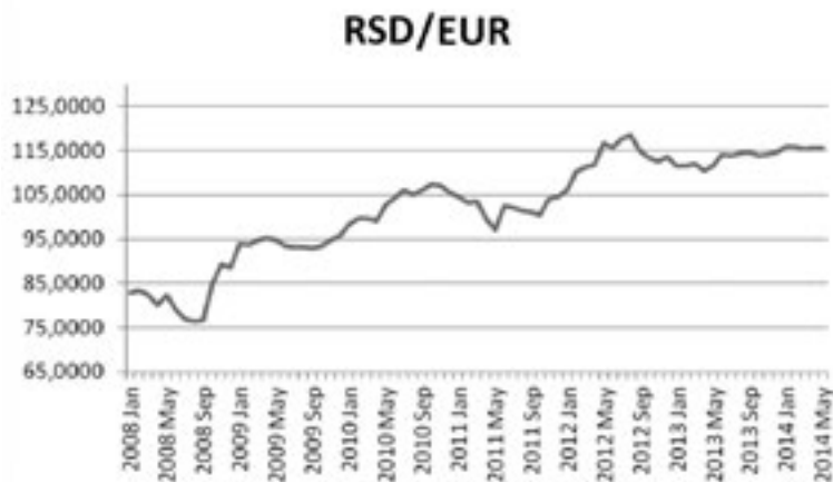
2. ábra: A szerb dinár euróval szemben jegyzett árfolyama (2008–2014)

Forrás: Európai Központi Bank és Szerb Nemzeti Bank.